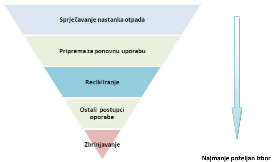
Slika 1 - Red prvenstva gospodarenja otpadom

ukoliko tehnička izvedivost ne dozvoljava uporabu otpada, odnosno ukoliko nema ekonomske opravdanosti za istu ( Slika 1 - Red prvenstva gospodarenja otpadom ).