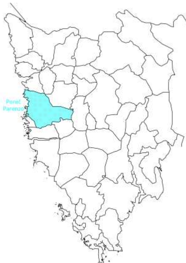
Slika 2 - Položaj Grada Poreča - Parenzo u Istarskoj županiji

Grad Poreč - Parenzo, smješten je u Istarskoj županiji, na zapadnoj obali poluotoka Istre ( Slika 2 - Položaj Grada Poreča - Parenzo u Istarskoj županiji ).